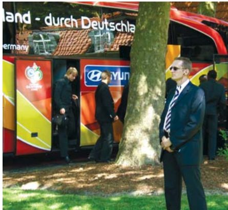
Die deutsche Nationalmannschaft in der Obhut von SECURITAS