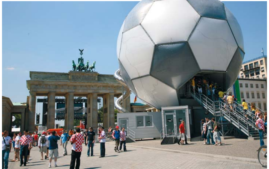
Fußball-Sommer 2006 in Deutschland