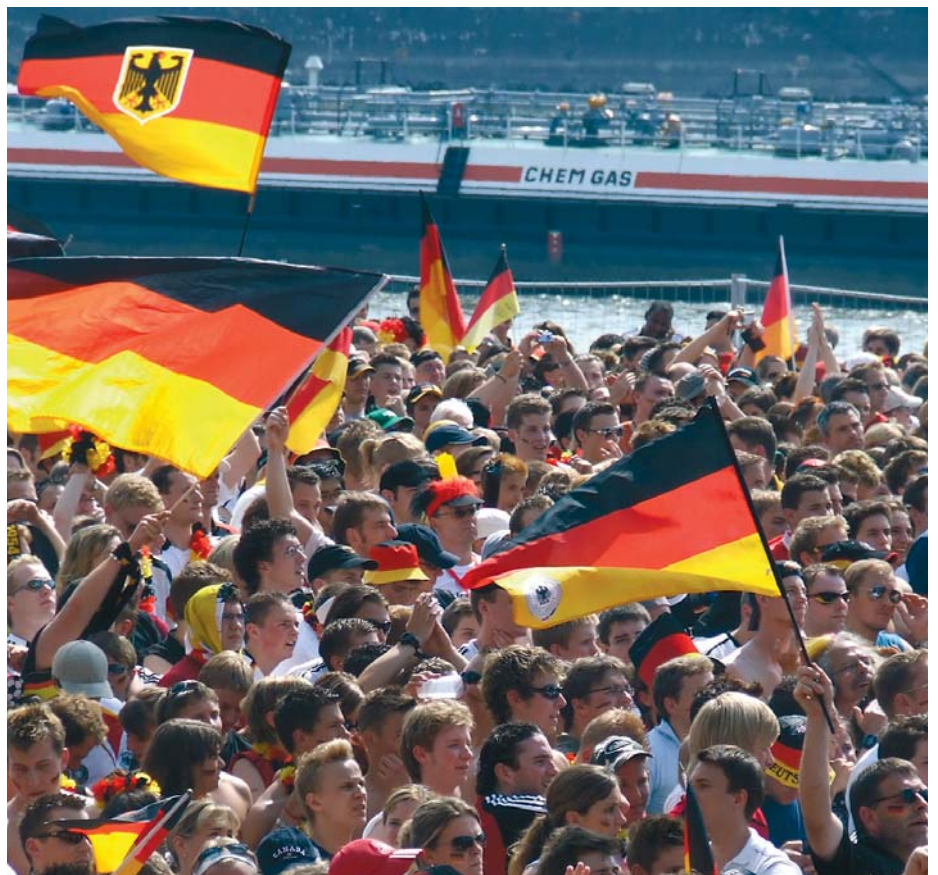
Millionen Fußballfans «zu Gast bei Freunden»

Dieses Konzept verfolgen seriöse Sicherheitsdienste schon seit einigen Jahren. Doch bei der Fußballweltmeisterschaft 2006 lernte die breite Öffentlichkeit erstmals diese neue Diplomatie der «Securities» kennen. Mit über fünftausend Mitarbeitern war die «Securitas Event Solutions» (NRW) während der Meisterschaft im Einsatz. Man spricht von einem der größten Dienstleistungsaufträge, der je in Deutschland vergeben wurde. Das Unternehmen nahm zur WM 150 Objekte – Mannschafts-Hotels, Trainingsanlagen, Fanmeilen – in seine Obhut. Es analysierte die Risiken, erarbeitete Sicherheitslösungen, legte Verfahren und Anweisungen für den Sicherheitsdienst fest und plante die erforderliche Logistik. Und es entwickelte Einstellungsverfahren sowie Trainingsprogramme für ihre Mitarbeiter. Ein wichtiger Baustein dabei: Eben jenes Fingerspitzengefühl und die Menschenkenntnis, ohne die die Mitarbeiter vor Ort nicht agieren können.